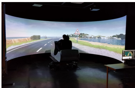
Simulateurs de conduite

Caisson d'immersion virtuelle 5 faces 4K de 3 mètres de côté